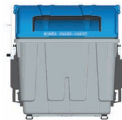
Papier und Karton container