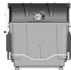
Container organischer Überbleibsel